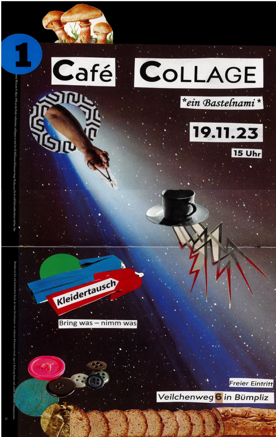
Café Collage, 2023 analoge Collage ca. 40cm x 25cm

Das Format ist ein Angebot an die Nachbarschaft und Freunde, sich in einem offenem Atelier zu treffen und das Medium Collage kennenzulernen. Ein gemütlicher Treffpunkt für Begegnungen, Basteln und Austausch.